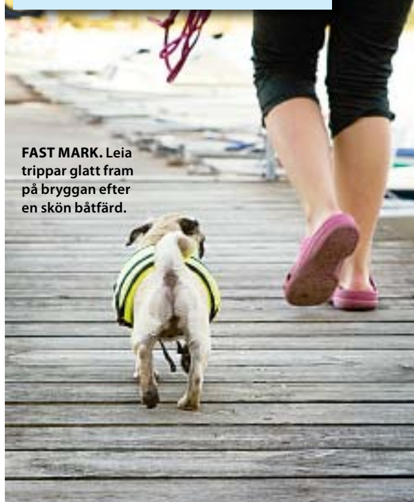
FAST MARK. Leia trippar glatt fram på bryggan efter en skön båtfärd.

båten. Men hundar och stövlar är ingenting som familjen tycker hör ihop. De anser att hundarna får dåligt fäste om de inte får vara bartassa på däck.